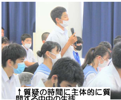
↑質疑の時間に主体的に質問する中中の生徒

を進めていきましょう。2校の学校説明会を集中して聴いていた3年生の中には、志望校として選択している生徒にとって、とても参考になったかと思います。1・2年生の皆さん、まだまだ進路決定は先だと思っているでしょうが、もう1・2年生の中には、志望校を決めている生徒がいるかと思います。将来なりたい、憧れる職業があれば、自ずと志望校が絞られます。自分の目標達成のために、今から進路面も意識していきましょう。