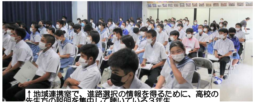
↑地域連携室で、進路選択の情報を得るために、高校の先生方の説明を集中して聴いている3年生